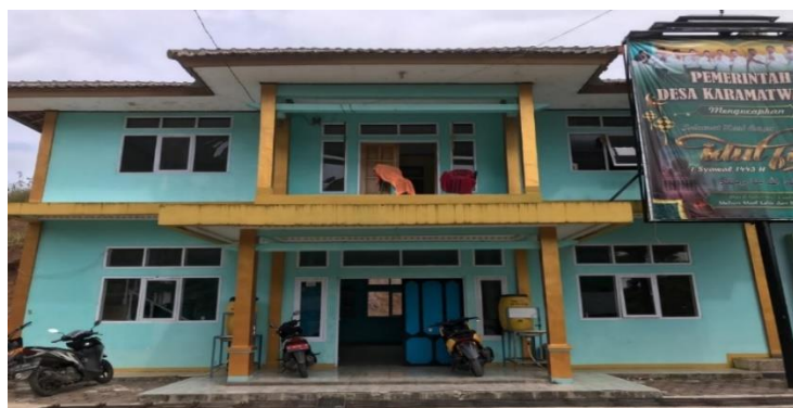
Gambar 1 Bangunan Desa Karamatwangi sekaligus tempat beroperasi BUMDes Karamat Jaya

BUMDes Karamat Jaya dalam melakukan Usaha simpan pinjam tidak lepas dari Peraturan Pemerintah Nomor 9 Tahun 1995 tentang Usaha Simpan Pinjam. Merujuk pada Peraturan Pemerintah Nomor 9 Tahun 1995, Bumdes Kramat Jaya membuat standar operasional dan prosedur (SOP) simpan pinjam bagi setiap warga dengan tujuan membantu dan melayani kebutuhan masyarakat Desa Karamatwangi dari aspek keuangan yang diharapkan dapat bermanfaat bagi peningkatan kesejahteraan masyarakat. Jenis pinjaman atau produk dana yang ada di BUMDes Karamat Jaya saat ini adalah Usaha Ekonomi Mikro (UEM) diperuntukkan bagi masyarakat dengan jenis usaha sebagai berikut: perdagangan, perindustrian, peternakan dan jasa. Cadangan pangan pemerintah desa (CPPD) diperuntukkan bagi masyarakat dengan jenis usaha pertanian dan kredit multi guna (KMG) diperuntukkan bagi pemenuhan kebutuhan rumah tangga atau prosedur simpan pinjam.