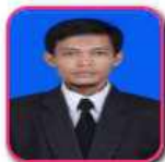
Parikhin Politeknik Piksi Ganesha Indonesia. Google sinta