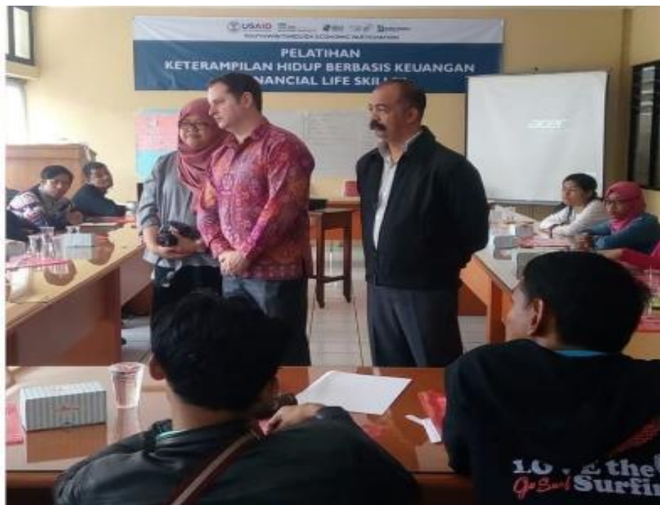
Gambar 2 : Ramah tamah dengan peserta