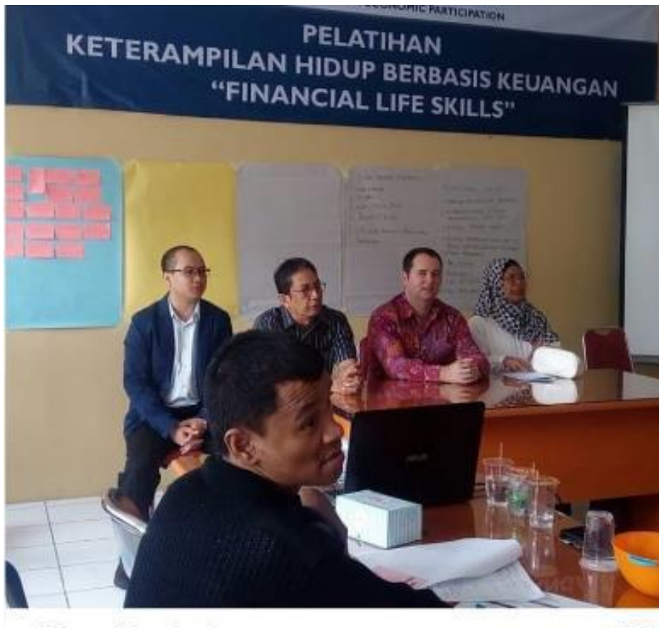
Gambar 4: monitoring pelatihan dari Politeknik Piksi Ganesha