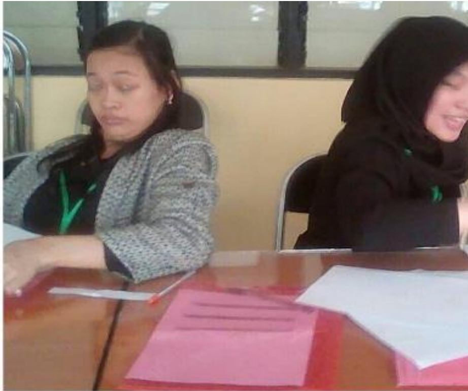
Gambar 3 : Peserta pelatihan