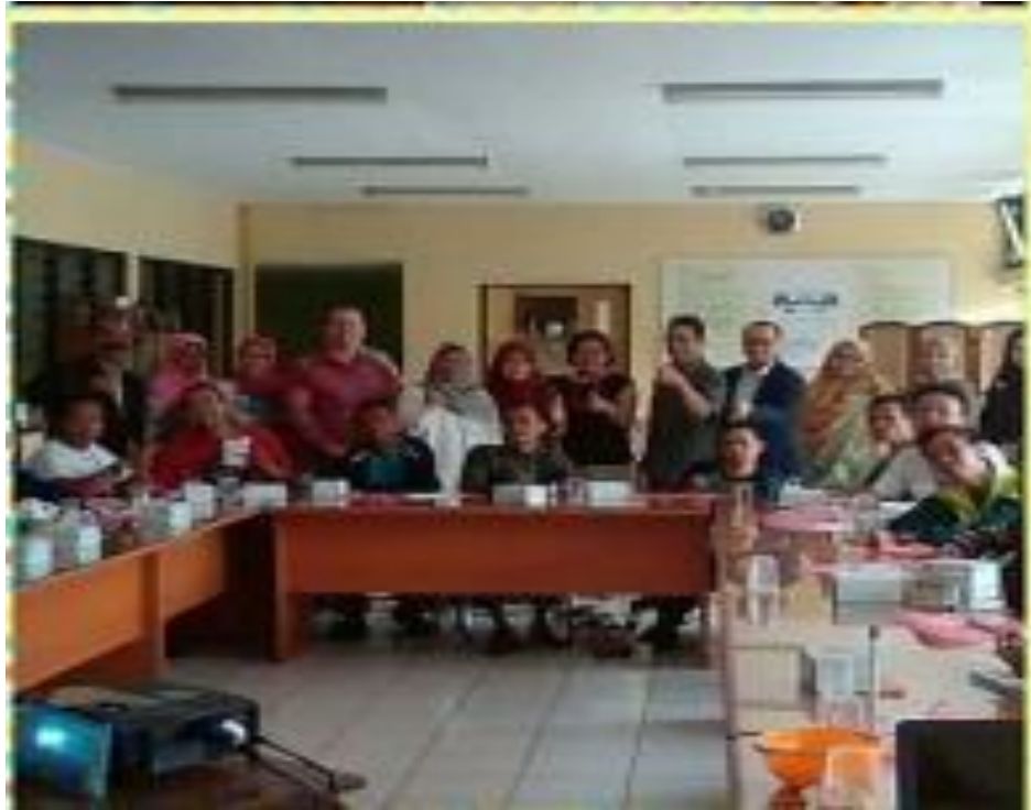
Gambar 1 : pembukaan Pelatihan oleh USAID dan RBM Kota Bandung