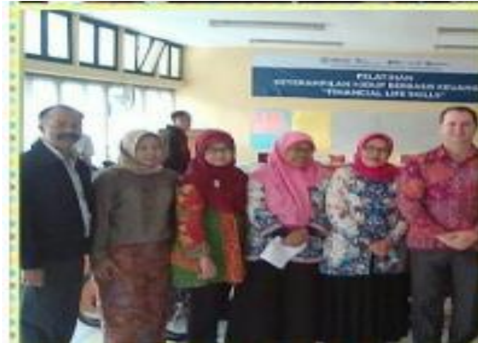
Gambar 5 : Monitoring dari RBM Kota Bandung