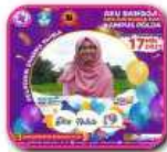
Asni Tafrikhatin Politeknik Piksi Ganesha Indonesia. Google sinta