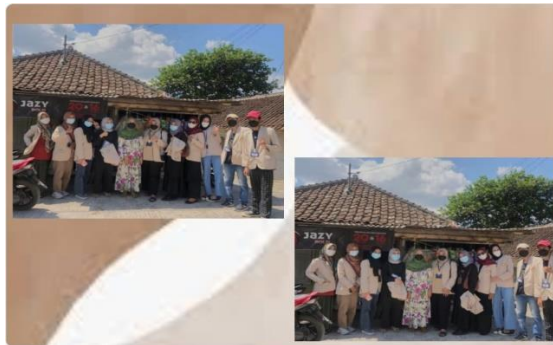
Gambar 1 : Mengunjungi UMKM