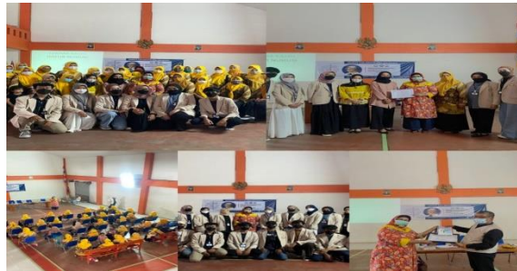
Gambar 2 : Kegiatan Seminar

Desa Mekarjaya Kecamatan Tarogong Kaler.dengan mengadakan seminar UMKM ini Kami menge'dukasi pelaku UMKM dalam penting nya Home Industry dimana