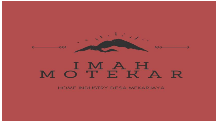
Gambar 4 : Logo Home Industry Desa Mekarjaya