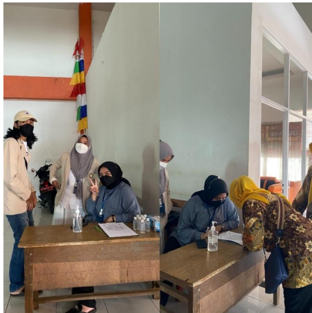
Gambar 3 : Penyaluran Protokol Kesehatan

Penyaluran Protokol Kesehatan Kepada Peserta yang hadir di Seminar berupa masker kesehatan, handsanitizer dan Menerapkan social distancing dalam kegiatan Seminar yang dilakukan sebagai protokol kesehatan yang perlu digunakan di tengah pandemi covid-19 di Era New normal ini.